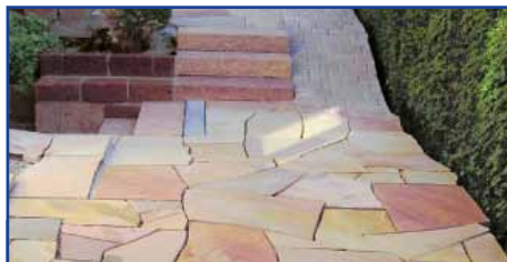
Die Fläche muss nach den Regeln der Technik verlegt und sauber und trocken sein.