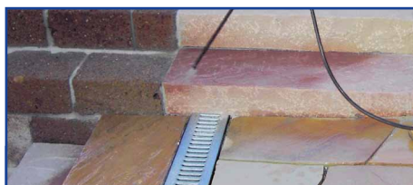
Auch senkrechte Flächen behandeln

Im Sommer diese Arbeit am besten am frühen Vormittag durchführen. Kehren Sie lose Verunreinigungen (Sand, Laub etc) mit einem harten Besen ab. Hartnäckige Flecken mit speziellen Reinigern entsprechend der Lithofin-Anwendungstabelle beseitigen. Nach dem Reinigen, die Fläche wieder gut trocknen lassen.