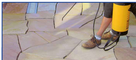
Auftragen von Lithofin FLECKSTOP ›W‹ mit Sprüherät

Die Oberflächentemperatur soll 10–25°C betragen, max. 30°C.