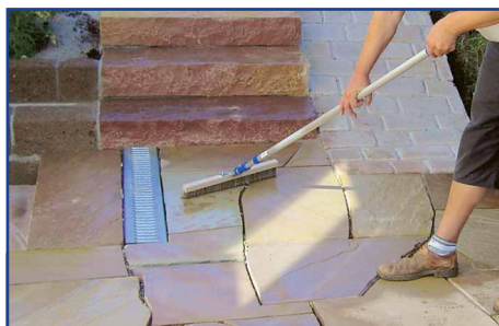
Lithofin FLECKSTOP ›W‹ gleichmäßig verteilen

Lithofin FLECKSTOP ›W‹ satt und gleichmäßig auf die gesamte Fläche auftragen, bei Absätzen und Treppen müssen auch senkrechten Flächen behandelt werden.