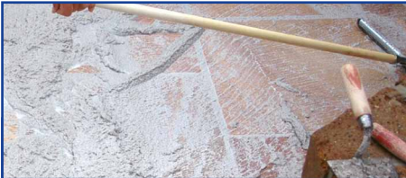
Ausfugen mit drainfähigem Epoxidharz-Fugmaterial

Flecken durch aufsteigende Feuchtigkeit können durch „Rundum-Imprägnierung“ vor dem Verlegen reduziert werden. Voraussetzung für dieses Verfahren ist, dass die Steinplatten trocken und sauber sind und in Splitt verlegt werden. Das allseitige Auftragen auf die Platte erfolgt durch Tauchen (ca. 30 Sekunden) oder Einstreichen mit einer Rolle oder einem Pinsel oder Einsprühen. Vom Material nicht aufgenommenes Produkt muss vor dem Trocknen abgewischt werden. Vor dem Verlegen oberflächlich abtrocknen lassen, da bei Verlegung im nassen Zustand ein Wirkungsverlust eintreten kann.