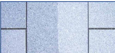
Mit Lithofin Resin-EX entfernt man Reste von Epoxy-Fugenmörtel