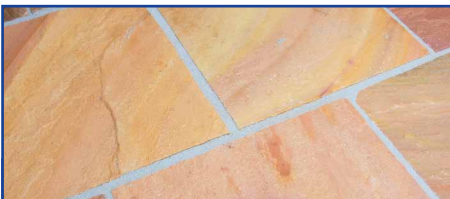
Die frisch verfugte Fläche wird zeitsparend gereinigt – sie zeigt sich klar und sauber.